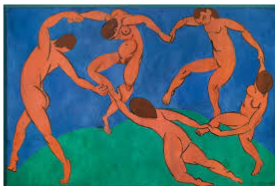
Henri Matisse: Le Dance, 1910., Ermitaž, St. Petersburg

(2. verzija djela nalazi se u MOMA-i u New Yorku)