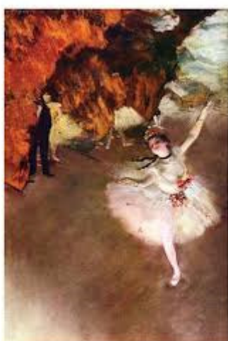
Edgar Degas: Primabalerina, 1878., Muzej D'Orsay, Pariz

(2. verzija djela nalazi se u MOMA-i u New Yorku)